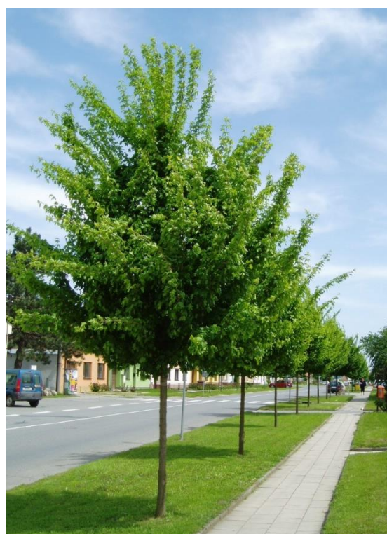
Obr. 4.: Stromořadí Acer campestre 'Elsrijk'