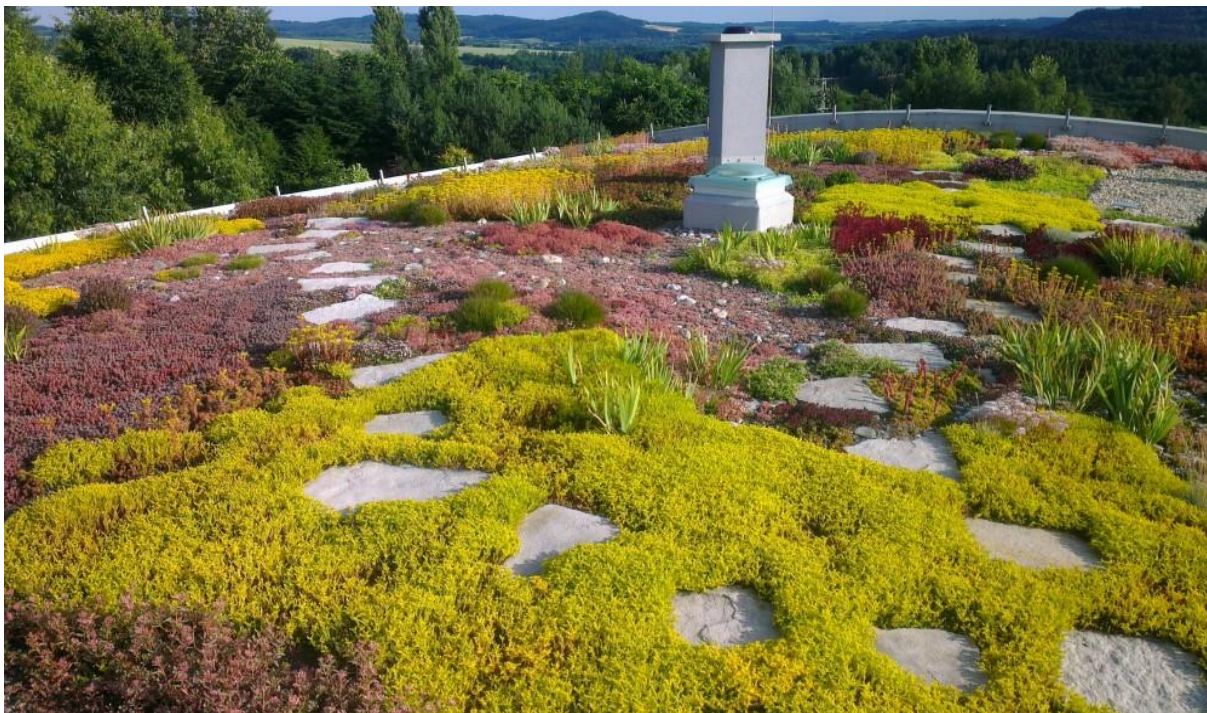
Obr. 3.: Osázení střešní zahrady