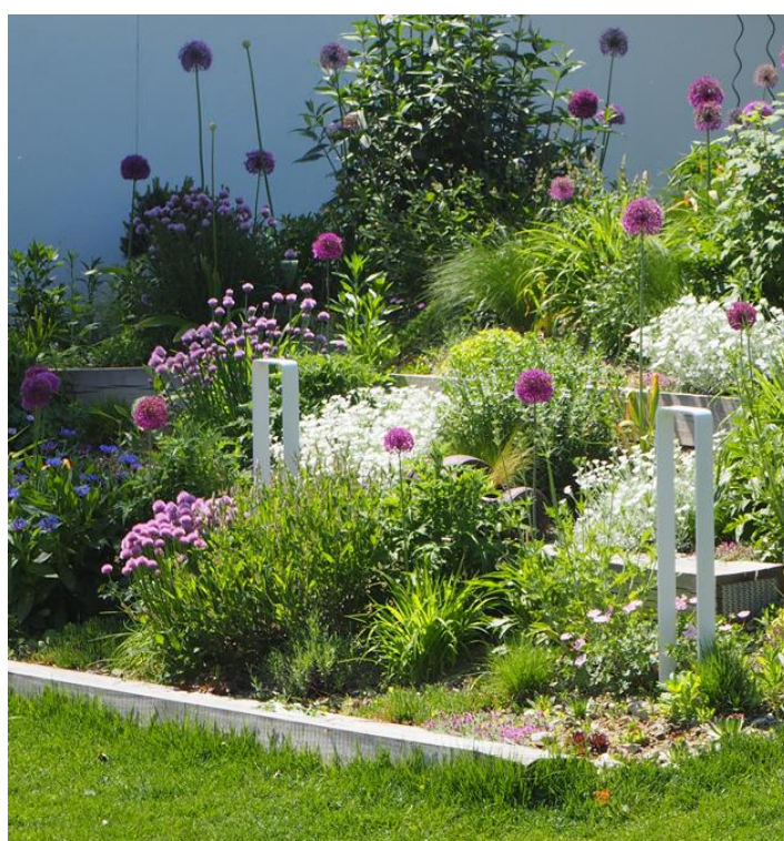
Obr. 2.: Trvalkové záhony lemující sedací zídky